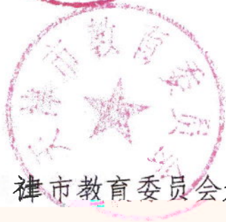
津市教育委员会天