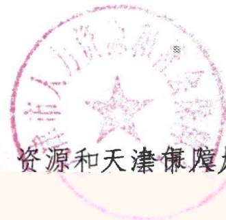
资源和天津保履局