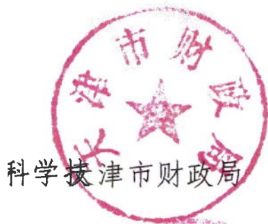
科学拔津市财政局